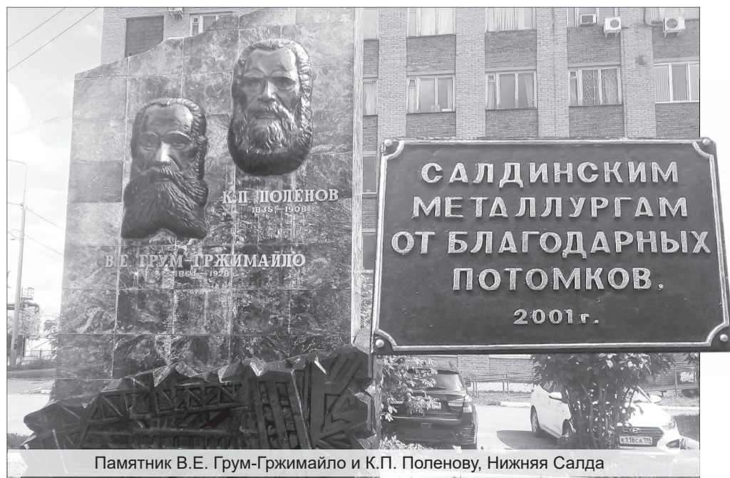
Памятник В.Е. Грум-Гржимайло и К.П. Поленову, Нижняя Салда