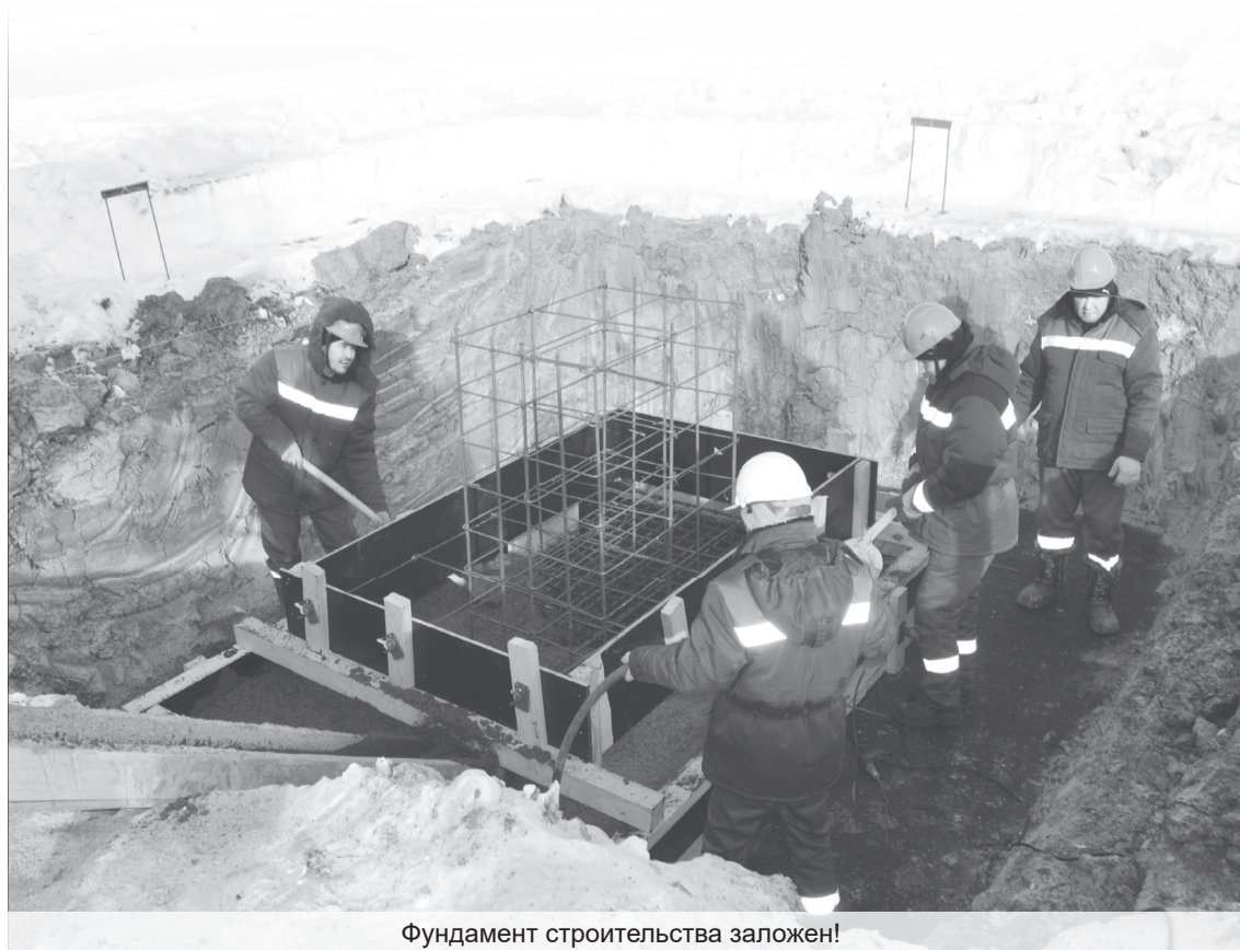
Фундамент строительства заложен!