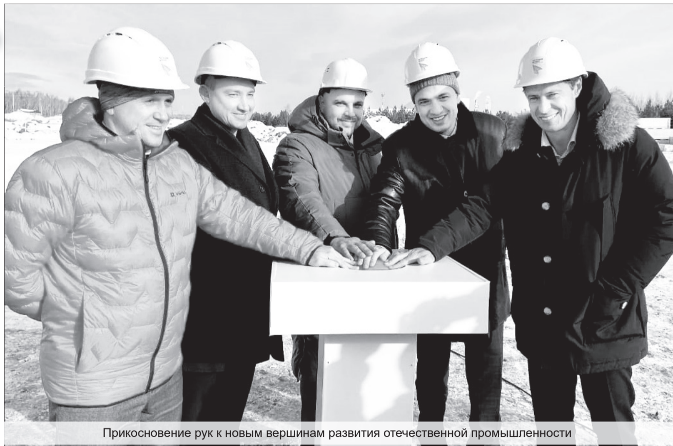
Прикосновение рук к новым вершинам развития отечественной промышленности

– По поручению губернатора Евгения Куйвашева в Свердловской области созданы максимально комфортные условия для работы с инвесторами. Важно, что ИКМЗ – наше местное предприятие, которому мы помогаем «вырасти» и в короткие сроки, уже на новой площадке,кратно увеличить объёмы производства. Этому способствуют налоговые и таможенные льготы, а также инженерная инфраструктура «Титановой долины». Появление такого предприятия ещё больше усиливает «титановую» компетенцию Верхней