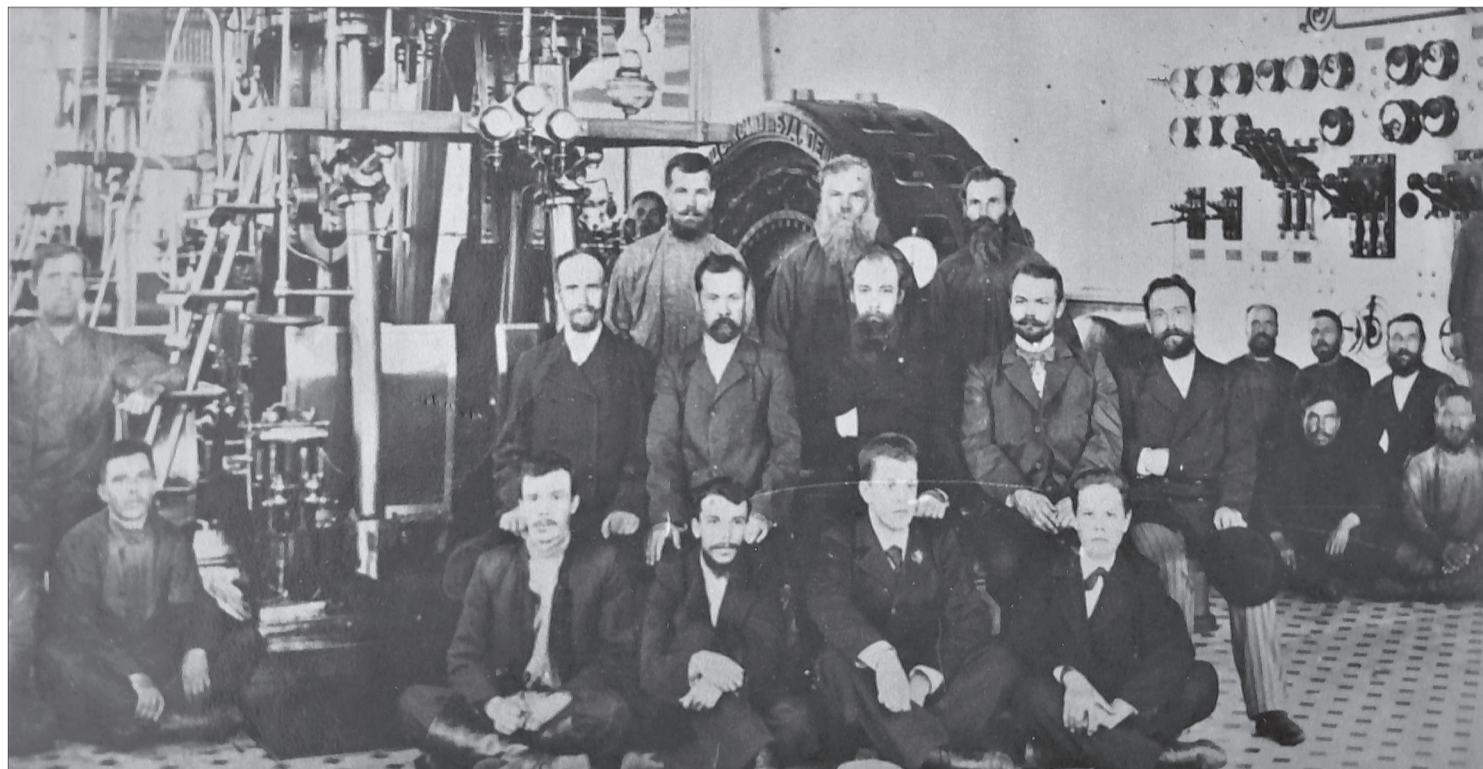
Владимир Ефимович Грум-Гржимайло и мастера Нижнесалдинского завода, конец XIX века

|| Статья посвящается светлой памяти и 160-летию со дня рождения В.Е. Грум-Гржимайло.