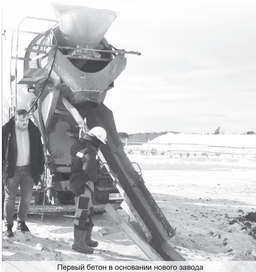
Первый бетон в основании нового завода